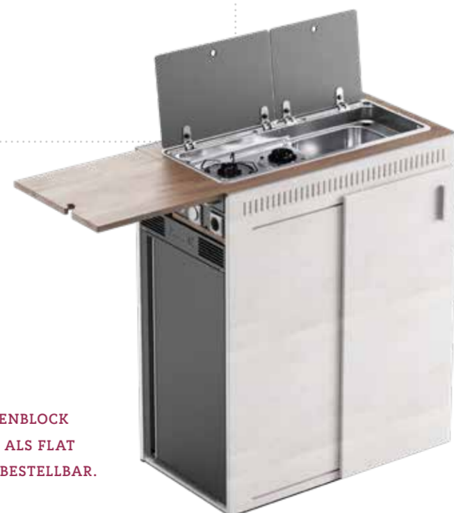
KÜCHENBLOCK AUCH ALS FLAT PACK BESTELLBAR.

Mehr zur Produktlinie VSTRONG unter vstrong.voehringer.com