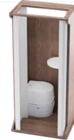
DIE VERSCHIEB- UND HERAUSNEHMBARE NASSZELLE.

Die komplette Nasszelle ist verschiebbar, herausnehmbar und wasserfest. Dank des EPS-Kerns ein echtes „Leichtgewicht“. Der Schichtstoff garantiert eine robuste Oberfläche und lässt Freiräume für Designer.